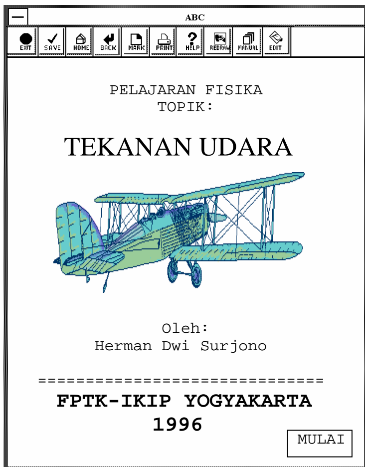
Gambar 2. Contoh halaman judul